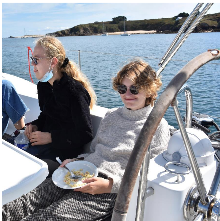
...Et qu'Esther profite d'un bon repas