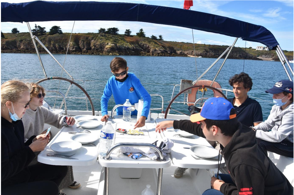
Au programme, jeux de société ...