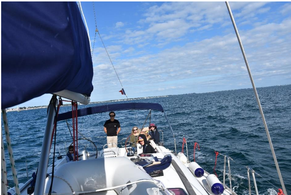
Et celui du deuxième jour en pleine mer aux alentours du Port Haliguen.