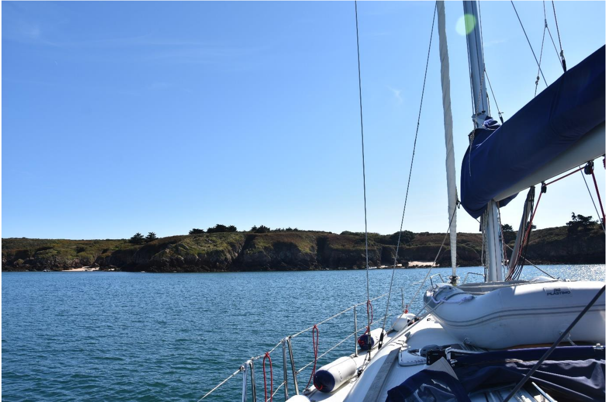
Le premier repas, pris au mouillage aux abords de l'île d'Houat