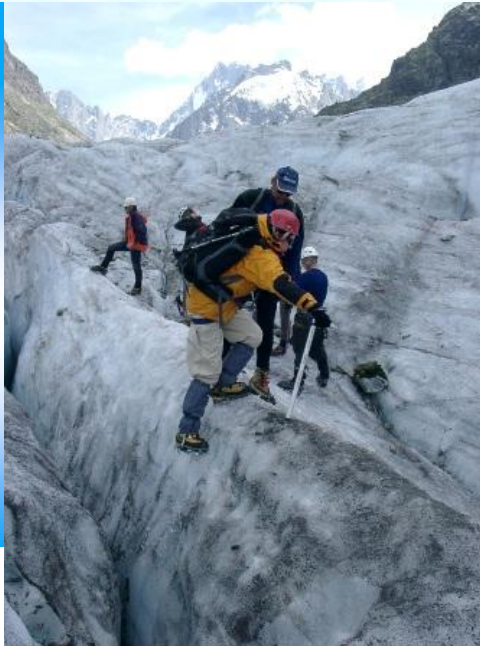
Sur la mer de Glace - Expédition 2005