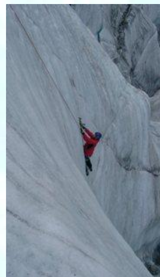
Mer de Glace Lors de l'expédition 2005