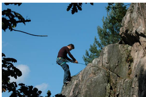
Escalade à la Roche Fleurie