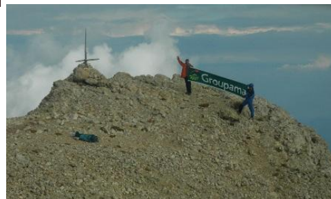
Au sommet de l'Obiou

Cette année, la même équipe, avec en plus un greffé des cornées, passait une semaine dans la vallée de Chamonix ... Ecole de glace en Mer de Glace, école d'escalade aux Gaillands, traversée et ascension des Aiguilles Crochues (2840 m) avant de se frotter à l'Aiguille du Tour (3542 m) qui fut atteinte le 24 juin.