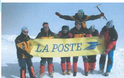
Au sommet du Cotopaxi

Début 2004, un Groupement de Loisirs Physiques et Sportifs (GLPS) issu du rapprochement de TRANS FORME et REVES D'ALTITUDES (association que j'ai créée en 2002 lors de l'expédition en Equateur) voyait le jour sous le nom de