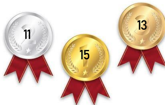
Tableau des médailles 2023

Retrouvez tous les résultats sportifs ici .