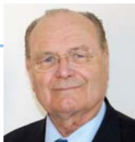
Louis GUEDON Député - Maire des Sables d'Olonne

La relation privilégiée entre la Ville des Sables d'Olonne et l'association de transplantés et dialysés s'est transformée depuis 2007 en un partenariat durable. En effet c'est à cette période que se sont déroulés les 16 e Jeux